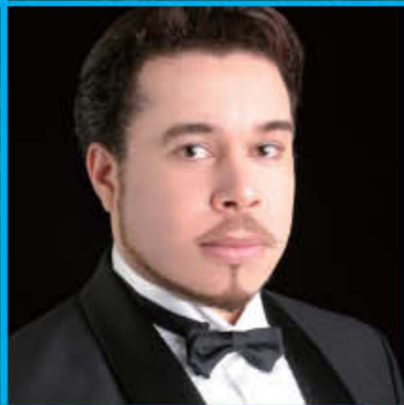
ロベルト・デイカンドイド ・テノール